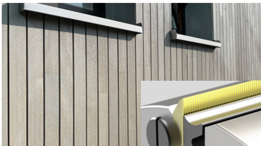
O uso de facas de aplainamento perfiladas produz revestimentos em fachada com um aspecto rústico.